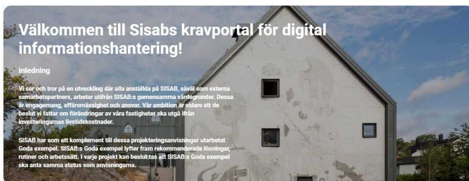
Figur 2 Användarlicens till Nationella Riktlinjer innefattar en egen kravportal.