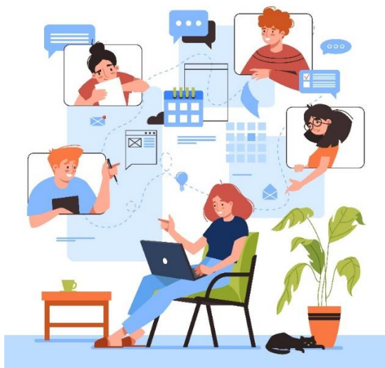
Figur 4 | programmet ingår snabbutbildningar och kunskapsträffar.

Årligen arrangeras Användardagen, vilket är ett tillfälle för alla användare av Nationella Riktlinjer att dela kunskap. År 2022 arrangeras Användardagen den 30 november klockan 9-12 i digitalt format.