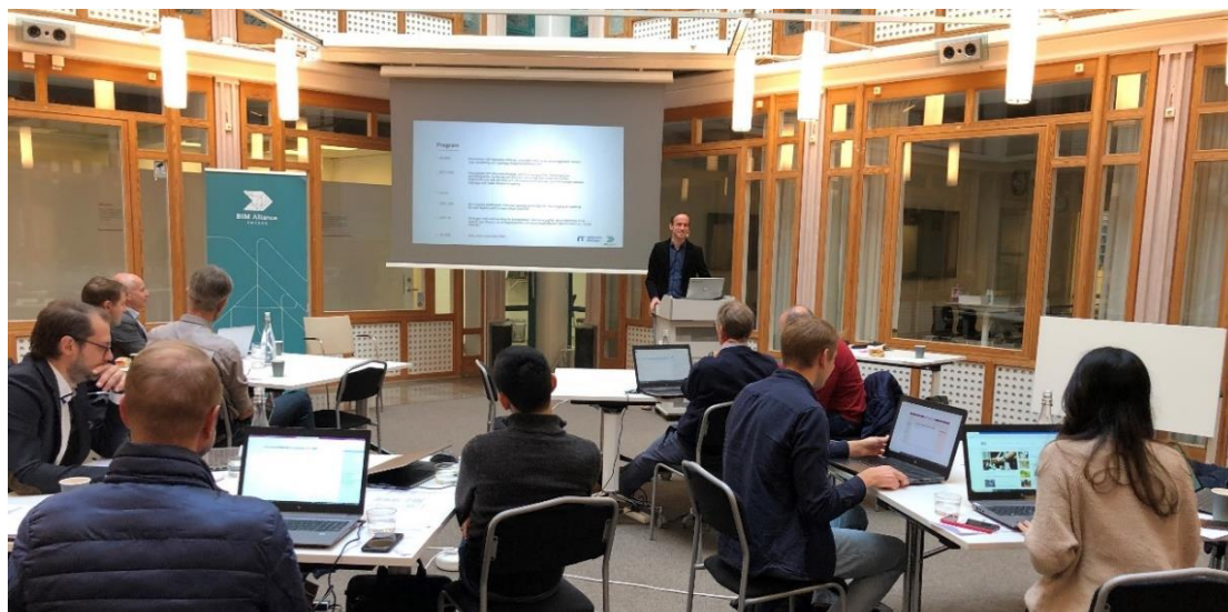
Figur 5 BIM Alliance utbildar certifierade implementeringsledare.

Utbildningen certifierad implementeringsledare arrangeras den 25 oktober och 29 november 2022. Utbildningarna utförs i Stockholm. Även andra utbildningsorter kan bli aktuellt framöver.